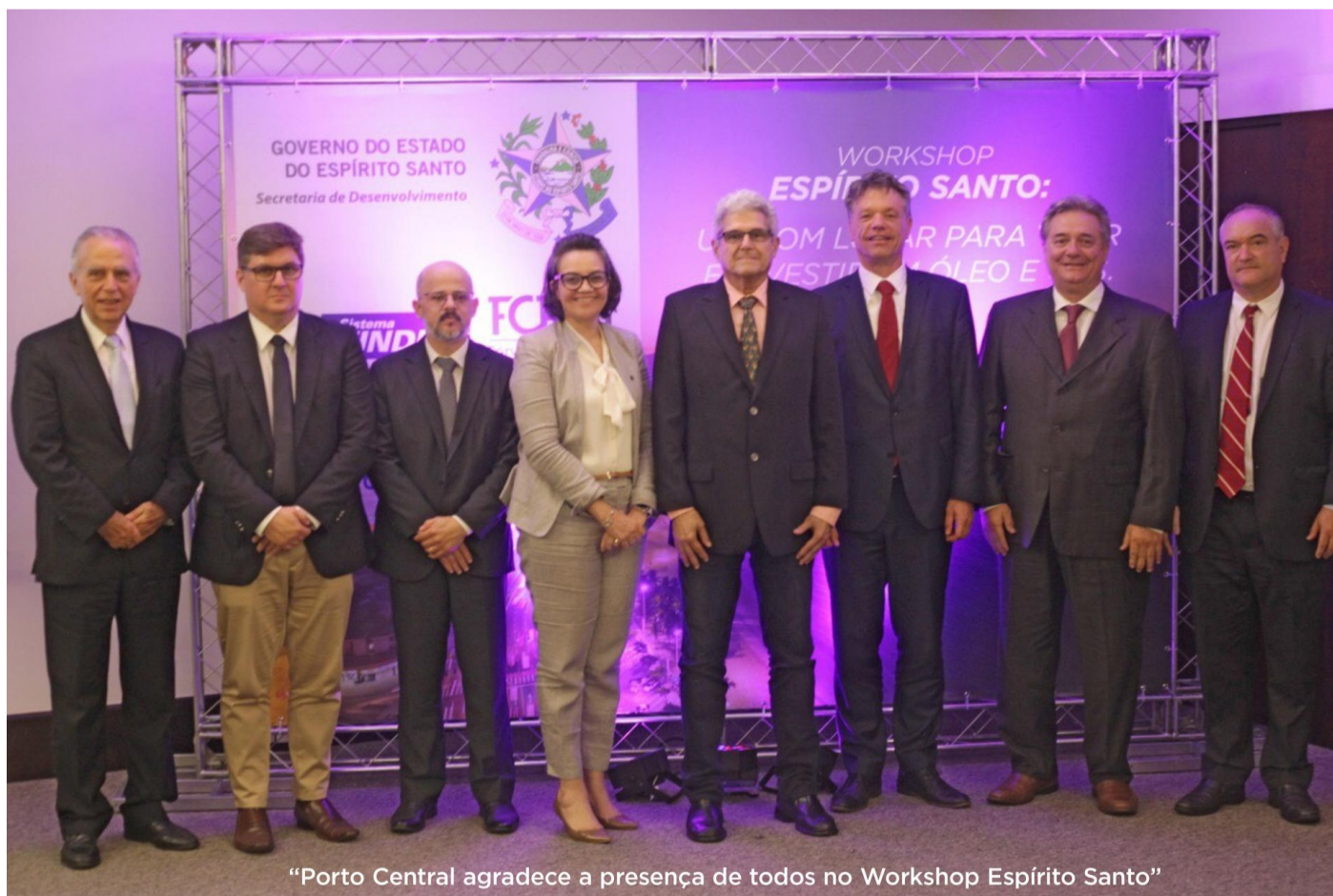
"Porto Central agradece a presença de todos no Workshop Espírito Santo"

The event was a success and definitely drew the attention to the enormous potential of Espírito Santo. The only state with a maximum rate in the National Treasury, with balanced public accounts, high education, quality of life, infrastructure, diversified economy, attractive tax incentives, and a privileged location to serve the oil and gas industry. A friendly and structured business environment to receive new investments and that has Porto Central, a new large-scale deep-water port, that will change the port perspective in Brazil.